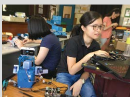
▲ STEM in mBot 2017

融入 STEM 的元素。Computer 一科會在課堂上教授同學如何使用控制 mBot (一種在 STEM 極為普遍的小型機械人) 的電腦軟件 "Scratch"，而 Integrated Science 則會在下學期時開始導入小組活動，要求同學合力設計一個能在新校舍使用的環保設計，設計會在試後活動期間展出。高中同學因選修科各有不同，學校不會要求她們必須參與，但有興趣的高中同學可以選擇參加航拍隊。