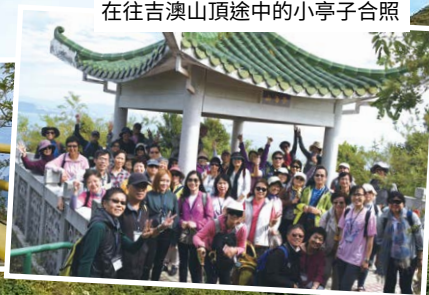
在往吉澳山頂途中的小亭子合照