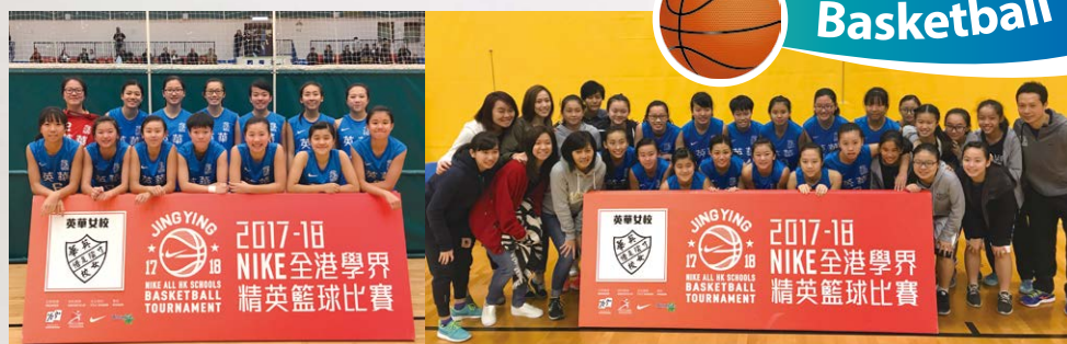
學界精英籃球賽，英華女籃勇闖四強，二月三日首戰去年冠軍協恩中學