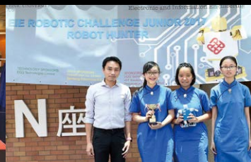
▲ STEM Robotics Competition 2017