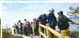
75米高的吉澳山頂，年長團友上來遠眺風景毫無難度