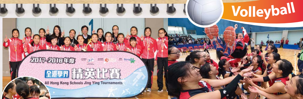
學界排球精英賽，英華女排激戰五局，2017年除夕圓夢摘冠