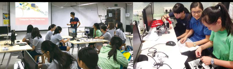
▲ 2017 Science Tour to Singapore