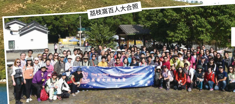
荔枝窩百人大合照