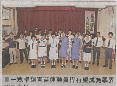
一眾卓越青苗運動員皆有望成為學界明日之星。