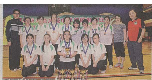
順德聯誼總會胡兆熾中學-青苗盃男女校組亞軍