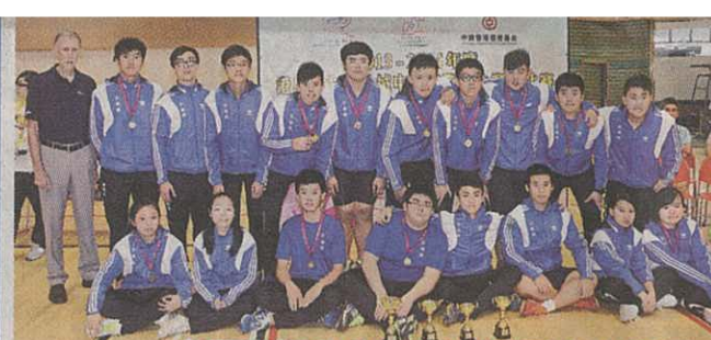
余振強紀念中學-青苗盃男女校組季軍