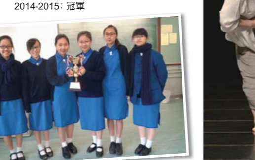
●全球隊 學界籃球賽(第一組) 2013-2014: 團體總冠軍