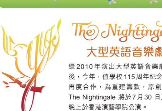
The Nightingale 大型英語音樂劇

《重建路上》第二冊 英華校舍重建路上各方貢獻者的訪談，每個故事背後，都盛載著對英華的厚愛和祝福。書中亦載錄多個細說捐款來由的小故事，這些來自四方八面的點滴心意，給我們無限鼓舞，激勵我們憑信邁進。(全文見 www.ywgs.edu.hk/redevelopment/YWbook2.pdf )