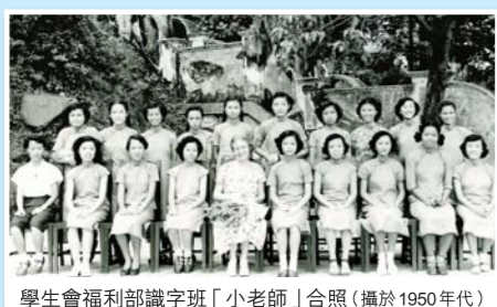
學生會福利部識字班「小老師」合照(攝於1960年代)

化素養，在品德及身、心、靈方面得到全面發展。同時訓練學生「寸陰是惜」、「作光無休」，本著「非以役人，乃役於人」的信念，以學回社會。