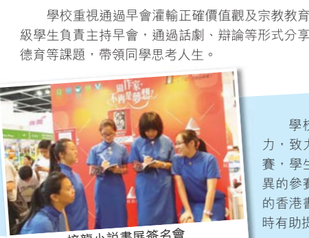
接龍小說書展簽名會

1949年，第一屆學生會成立，當時香港較少學校有學生會組織。學生籌辦活動，從而訓練獨立、自主性格和學會承擔。在1950至1960年代，學生會福利部將售賣校簿的營運所得加上學校補貼，於暑假為社區舉辦「識字班」。由編排教學計劃、設計教材與活動，以至授課，全部由學生自己負責。當時的英華兒女，已具備勇於接受挑戰和服務社群的精神。