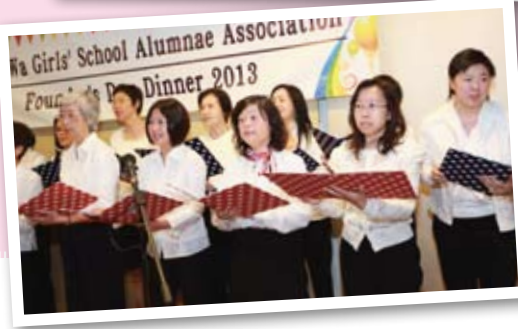
The performance of the Alumnae Choir during the Founder's Day Dinner 2013