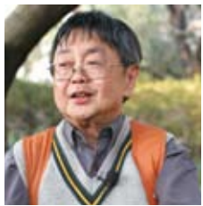
著名歷史學家 丁新豹博士