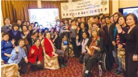
▲ YWGS big family photo at the fund raising night