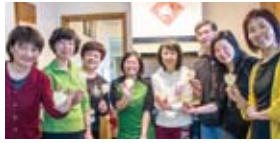
▲ First batch cookies baked