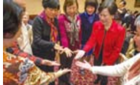
▲ Childhood game challenge to win the lucky draw prize