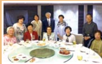
▲ 同學與石校長拍照留念