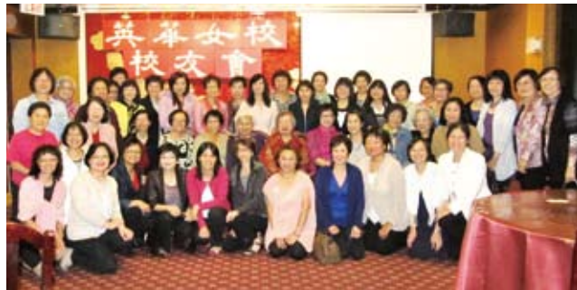
▲ 25th Anniversary Dinner Gathering

contributed CAD2,800 to the School Redevelopment Fund. After finishing the cake and dinner, with group picture taken, everyone left with joy and memory of a fun evening.