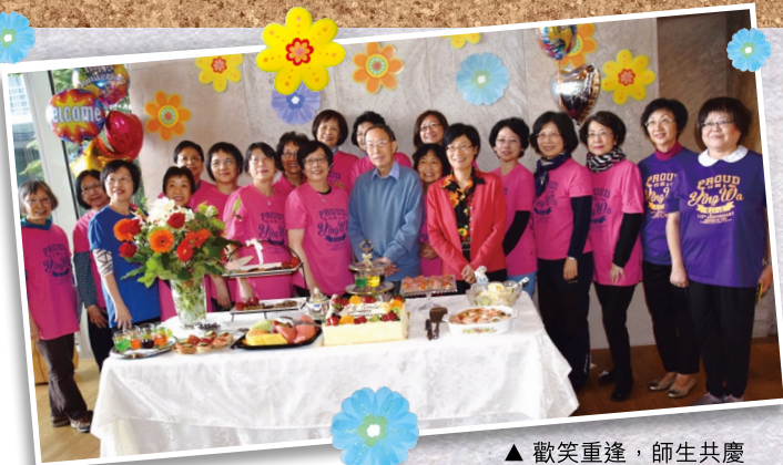
▲ 歡笑重逢，師生共慶