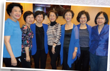
▲ 自小學起已是好友的七朵金花